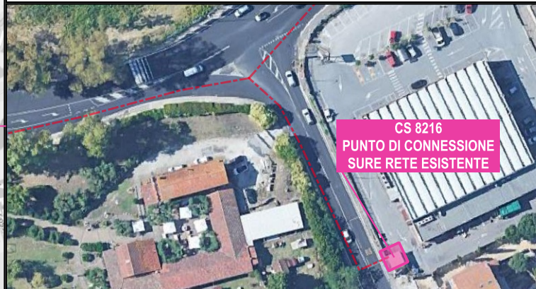
CS 8216 PUNTO DI CONNESSIONE SURE RETE ESISTENTE PUNTI DI CONNESSIONE ELETTRODOTTO SU RETE ESISTENTE PRESSO CS ESISTENTE 8216 SITA IN VIA DEL FOSSO DELLA MAGLIANA 80