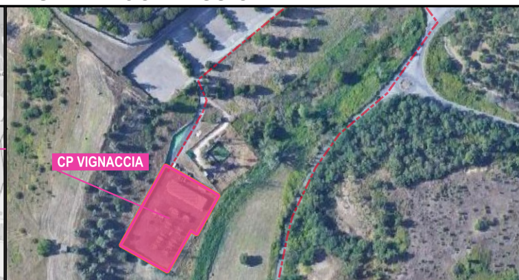
CP VIGNACCIA PUNTO DI PARTENZA NUOVO ELETTRODOTTO DA CP VIGNACCIA PRESSO LARGO DEI LANGOSCO SNC