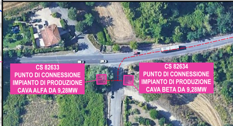
CS 82633 PUNTO DI CONNESSIONE IMPIANTO DI PRODUZIONE CAVA ALFA DA 9,28MW CS 82634 PUNTO DI CONNESSIONE IMPIANTO DI PRODUZIONE CAVA BETA DA 9,28MW PUNTI DI CONNESSIONE IMPIANTI DI PRODUZIONE SU CABINE A CURA CLIENTE PRESSO VIA PORTUENSE 881