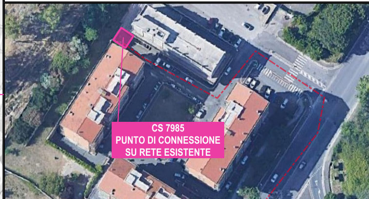
CS 7985 PUNTO DI CONNESSIONE SU RETE ESISTENTE PUNTI DI CONNESSIONE ELETTRODOTTO SU RETE ESISTENTE PRESSO CS ESISTENTE 7985 SITA IN VIA SILVIO SBRICOLI 45